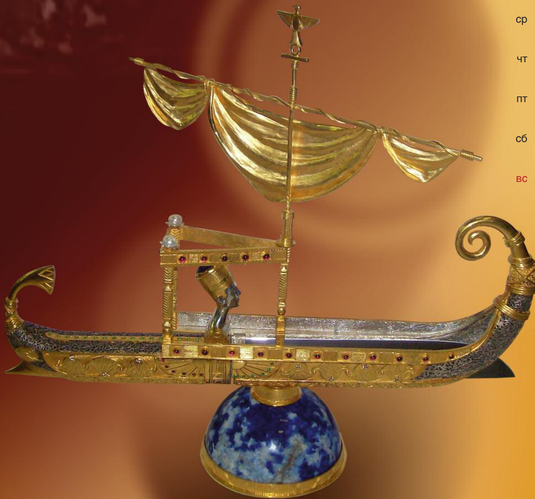
Настольная композиция «Ладья фараона» СПб, 2008 г.

Авторы – А. Тихонков, В. Шипицын При участии – Е. Лобовой Дамасская сталь – Ю. Саркисян