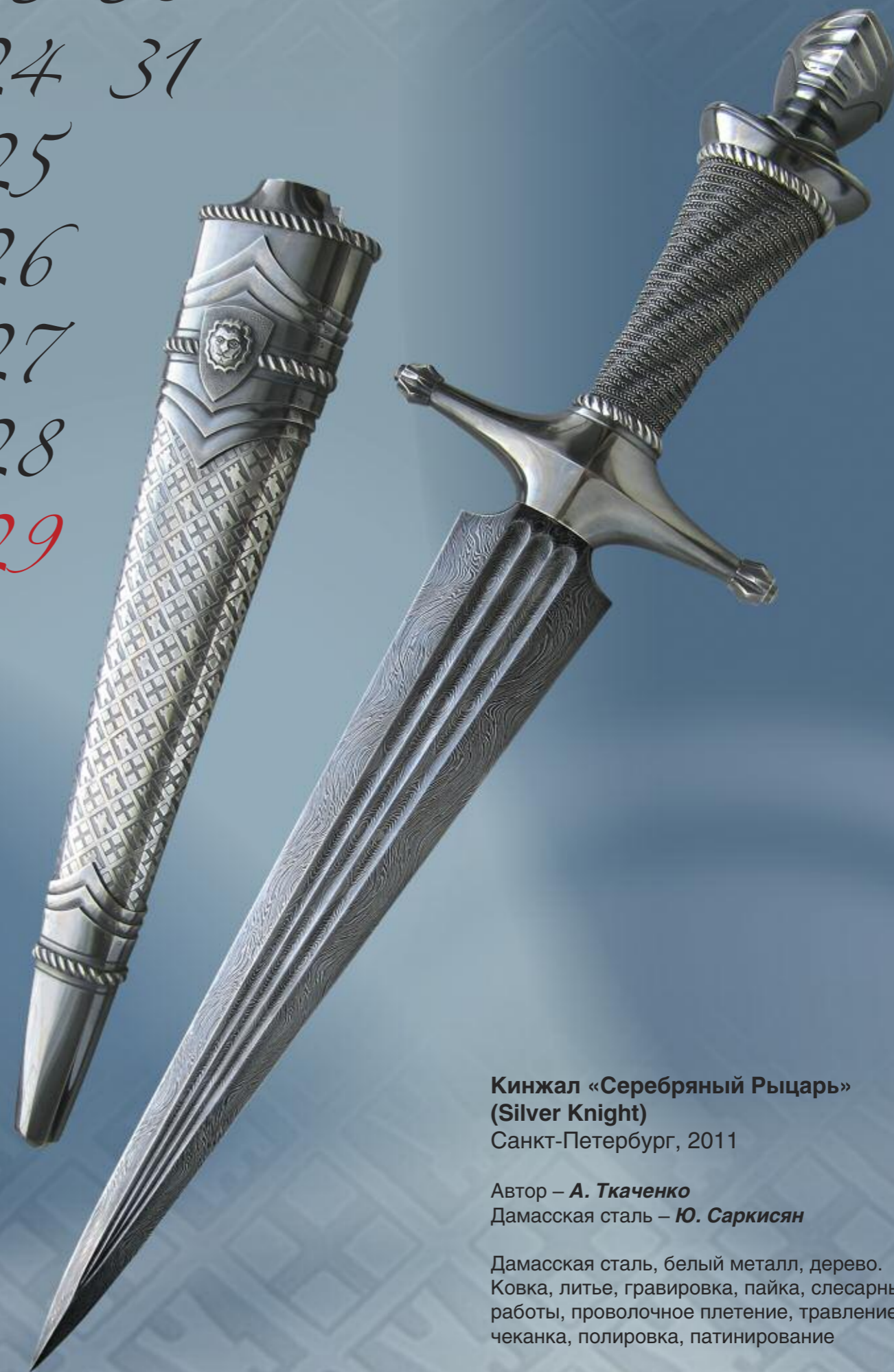
Кинжал «Серебряный Рыцарь» (Silver Knight) Санкт-Петербург, 2011

Автор – А. Ткаченко Дамасская сталь – Ю. Саркисян