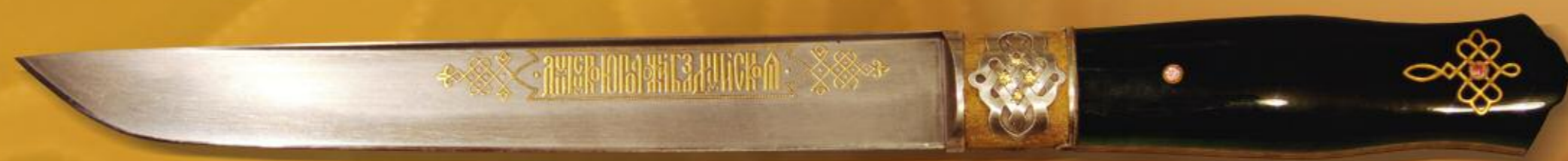
Нож в ножнах «Торжество славян» Тула, 2011 год